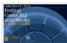
Festival Como Città della Musica 2013