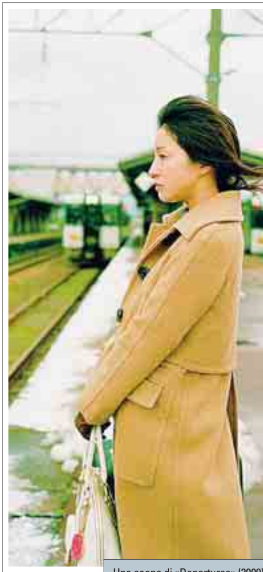
Una scena di «Departures» (2009).