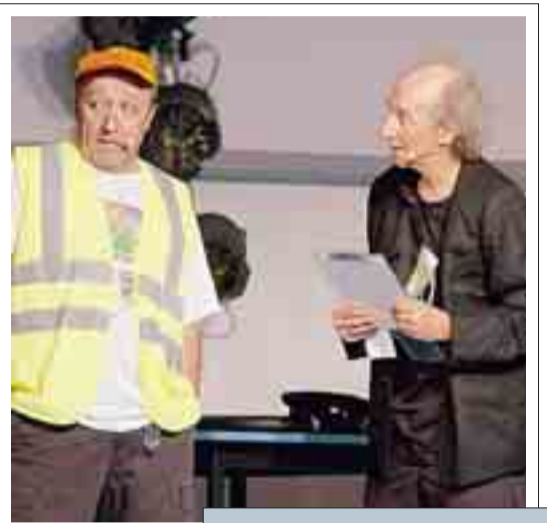
I Fichi d'India a Menaggio (FOTO SELVA)