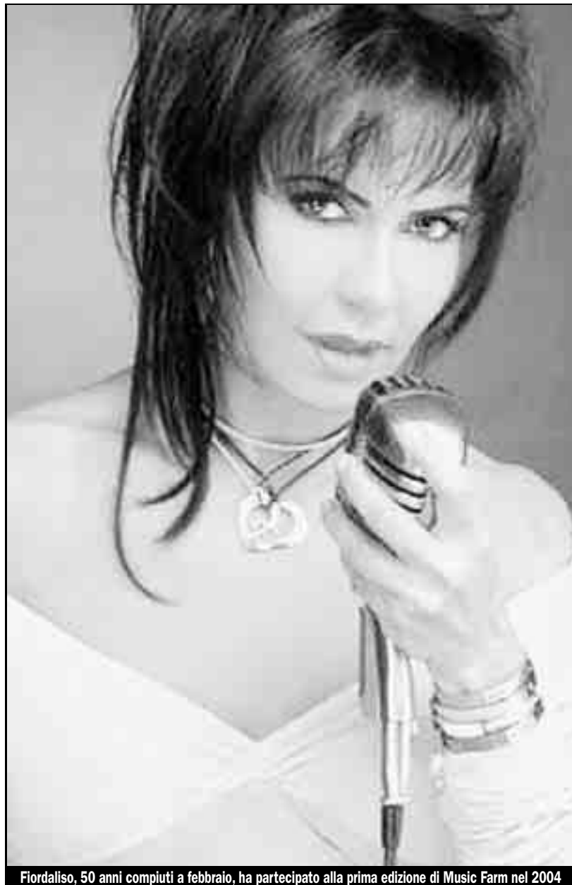
Fiordaliso, 50 anni compiuti a febbraio, ha partecipato alla prima edizione di Music Farm nel 2004

Fiordaliso Casinò di Campione d'Italia , stasera, ore 22