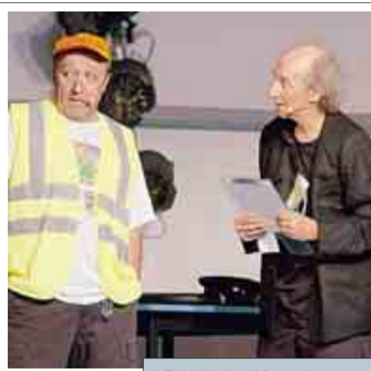
I Fichi d'India a Menaggio (FOTO SELVA)